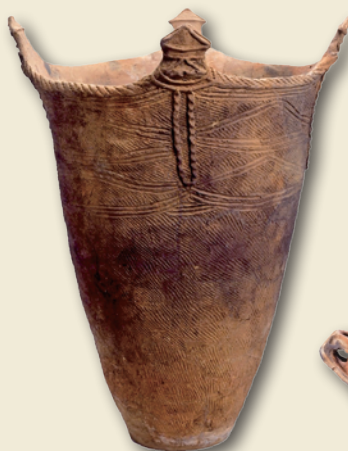
円筒式土器 Cylindrical pot