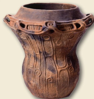
大木式土器 Daigi-style pot