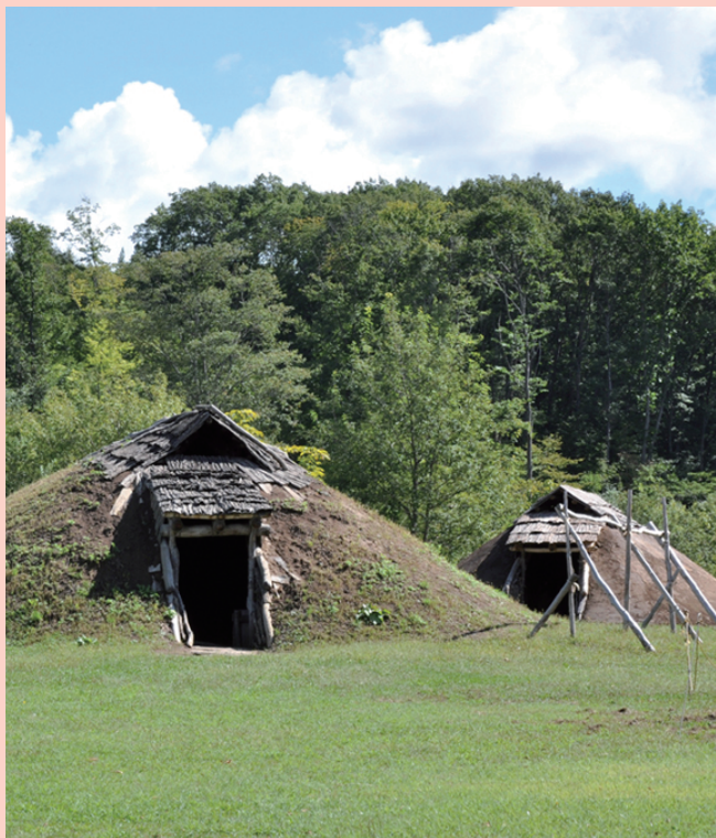
復元竪穴建物／Reconstructed pit dwellings