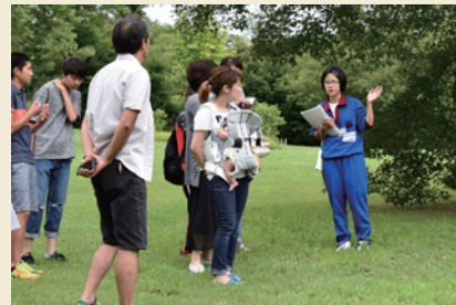
子どもガイド Kid guides

Volunteers, mainly local citizens, help visitors as guides and assist events as supporting staff. People living nearby gather twice a year and join forces to clean the archaeological site. The Goshono Site receives a lot of support from local communities.