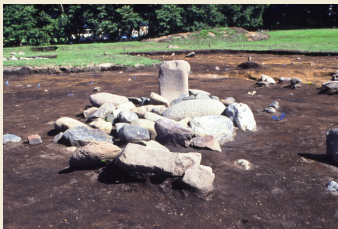
配石遺構／Remains of stone arrangements