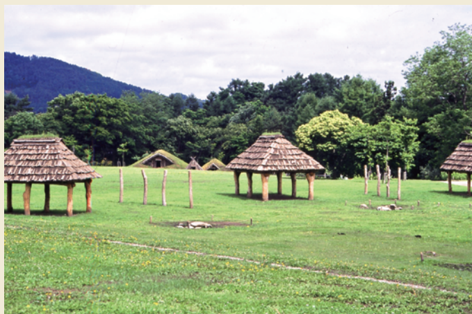
復元された中央部の掘立柱建物／ Reconstructed pillar-supported buildings in the central area of the site