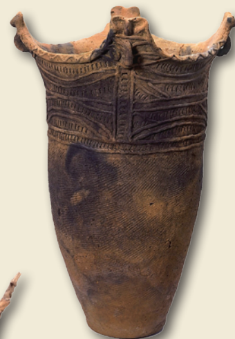
円筒式土器 Cylindrical pot