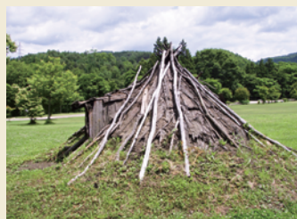
復元樹皮葺き建物 Reconstructed dwelling with the bark roof