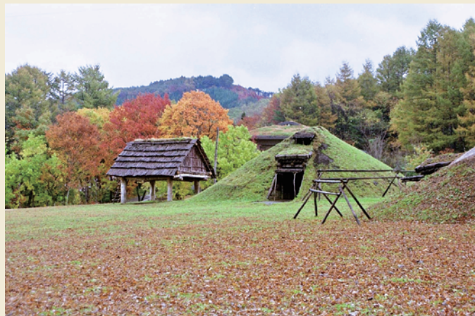
東ムラ／ Eastern village