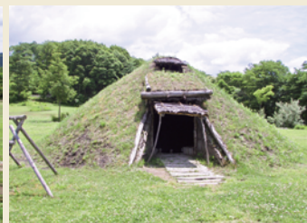
復元土屋根建物 Reconstructed dwelling with the soil roof