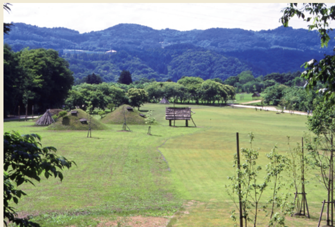
御所野遺跡遠景（東から）／ Distant view of the Goshono Site (from the east)