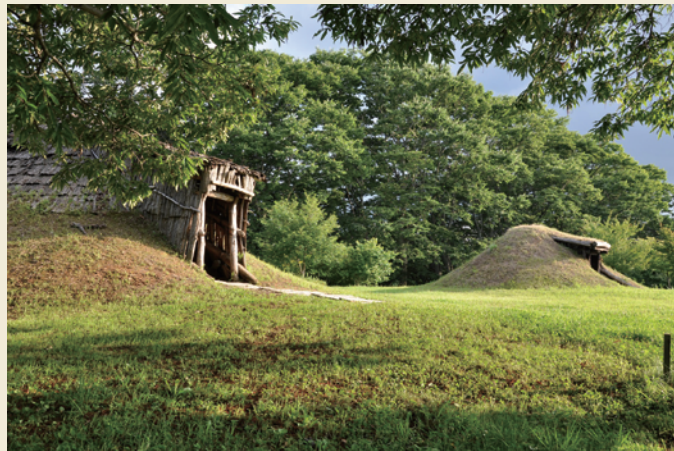
中央ムラ／ Central village