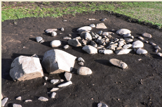
配石遺構／Remains of stone arrangements