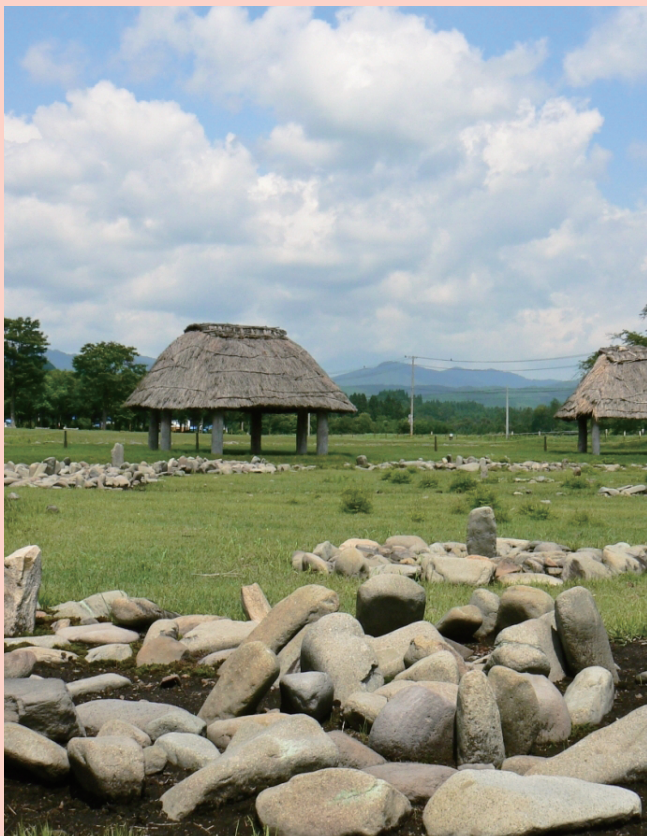
万座環状列石 / Manza Stone Circle