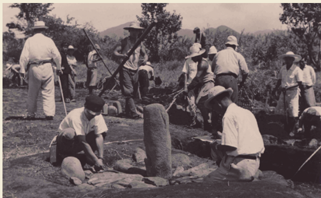
昭和26・27年の国営発掘

Excavation by the national government from 1951 to 1952