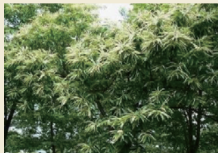
クリの木 Chestnut trees