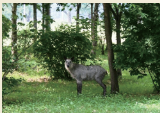
縄文の森とカモシカ Japanese serow in Jomon forest

Not only archaeological sites but also their natural settings are conserved. The two stone circles remain here much as they were 4000 years ago. The Jomon forest, which has been planted since 1998, has now become big and is still growing.