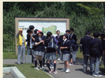
ボランティアガイドによる 案内の様子 Interpretation by voluntary guides