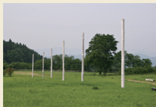
柱列 Row of pillars