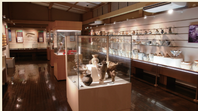
展示ホール / Exhibition hall

縄文時代の雰囲気を感じてもらいたいために、大湯環状列石では遺跡の中に案内板などを設置していません。大湯ストーンサークル館では遺跡についての解説と、遺跡から出土した土器などの展示を行っています。まず、大湯ストーンサークル館で遺跡のことを知り、それから遺跡の中を歩くことをお勧めしています。もっと詳しく知りたい方はボランティアガイドがご案内します。