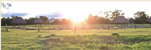
夏至の日没 / Sunset on the summer solstice

The vast plateau embracing the site has the Oyu River flowing along the western skirt. On the upstream of the Akuya river sits Mt. Morosuke, which produces the material of the stone circle, quartz porphyry. In the east of the plateau stands Mt. Kuromata which boasts a beautiful conic shape.