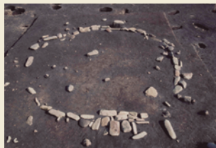
環状配石遺構 Remains of a circular stone alignment