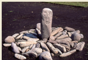
日時計状組石 Stonework in the shape of a sundial