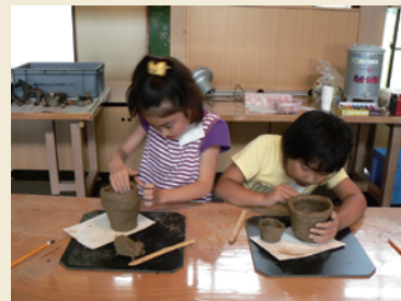
土器作りや勾玉作りが 体験できます Visitors participating in pottery making and gem stone processing

Because we want you to feel the atmosphere of the Jomon Period 4000 years ago in the site, we have no guide boards in the site. At the Oyu Stone Circles Museum, we provide commentary on the site and exhibits relics excavated in the site. So we recommend that you learn about the site first at the Oyu Stone Circles Museum and then go out and walk through the site.