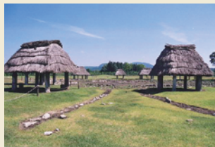
掘立柱建物跡 Remains of pillar-supported building

Besides the stone circles, remains of such structures as pit dwellings, pillar-supported buildings and rows of pillars have been discovered. All of them are considered as very important in the study of the stone circles. Some of them have been reproduced and maintained.