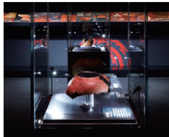
漆の美展示室 Jomon lacquerware on display

The Korekawa Archaeological Institution near the Korekawa site exhibits the unearthed artifacts that show the craftsmanship of the Final Jomon period. It also organizes seasonal special exhibitions introducing the attractive findings of the Jomon culture in the Tohoku region and elsewhere throughout Japan.