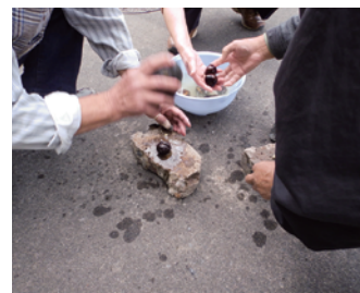
トチの実で縄文クッキング Cooking horse chesnuts