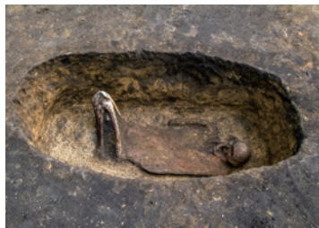
土坑墓 Pit burial