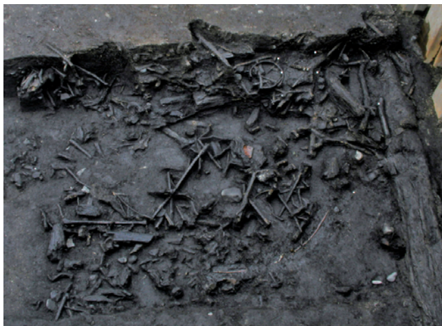
低湿地捨て場 Remains of a dumping ground excavated in the low wetland

At the Korekawa site, archaeological excavations are underway to find substance of this Jomon settlement. So far, archaeological remains of dwellings, graves, dumping grounds, and shell mound have been found. The alkaline environment of the shell mound and dumping grounds preserves the remains of animals and plants in good condition, providing an important information about how people used animals and plants in the Jomon period. Joint researches are also carried out with external research institutes to draw new information from this archaeological site.