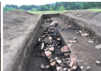
埋設土器・捨て場 / Burial jar / Dump