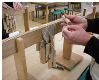
縄文の布を編む Making a Jomon cloth

Various programs are provided at the Korekawa Archaeological Institution for visitors to experience how people made different things in the Jomon period. Participants in these programs can learn the craftsmanship of the Jomon people in detail.