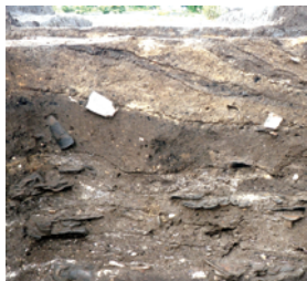
貝塚 Shell mound