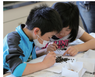
企画展イベント Special exhibition event